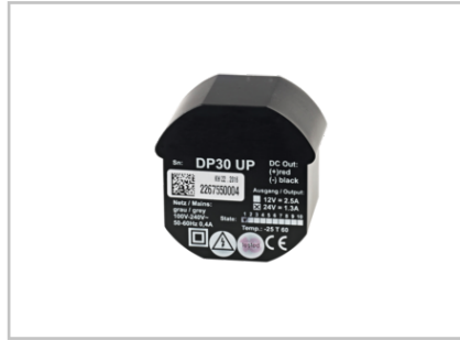
Schaltnetzteil 24 V DC, 1,25 A UP 2016370