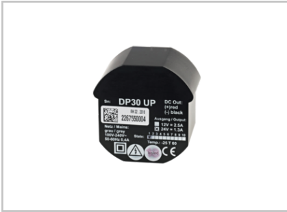
Schaltnetzteil 24 V DC, 1,25 A UP 2016370