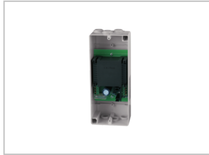
Netzteil 24 V DC / 1,0 A AP 629054