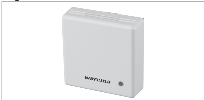
Abb. 1 MWG Feuchte und Temperatur innen

Der Messwertgeber Feuchte und Temperatur innen dient zur Erfassung der Raumtemperatur und der relativen Feuchtigkeit im Wohnbereich oder in Wintergärten.